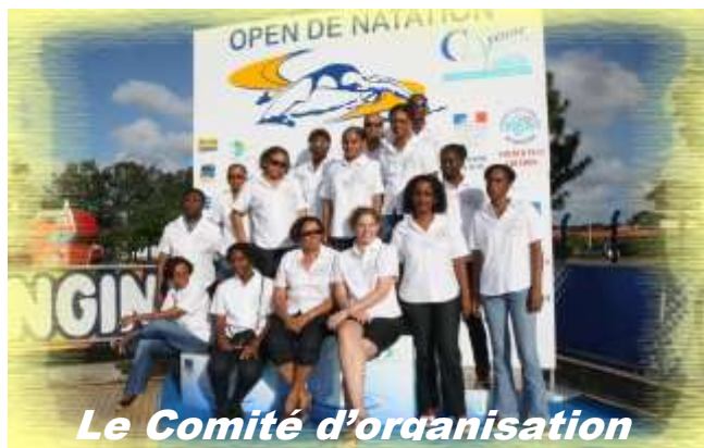
Le Comité d'organisation