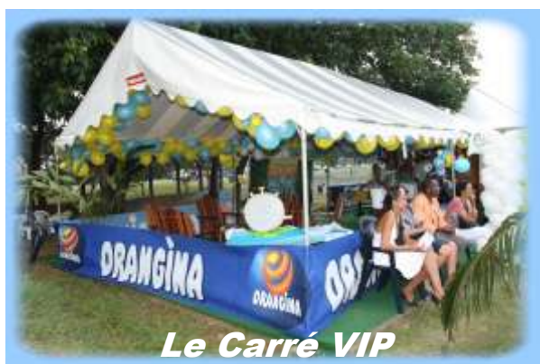
Le Carré VIP