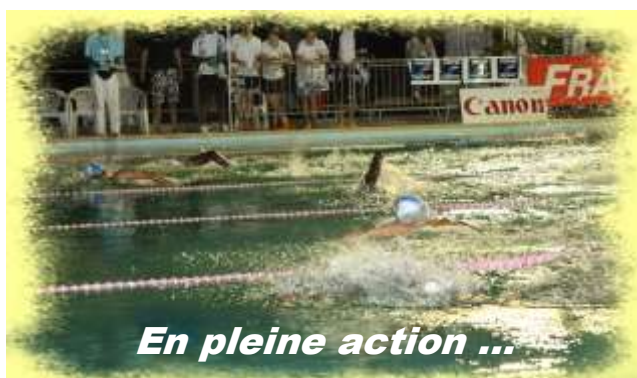
En pleine action ...