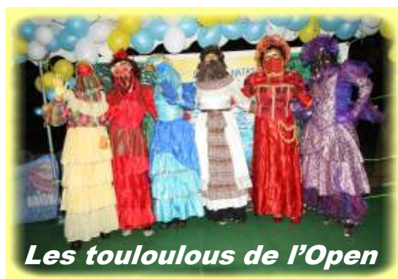
Les touloulous de l'Open